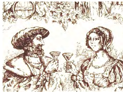
L'abus d'alcool est dangereux pour la santé. À consommer avec modération.

Samedi 9 et dimanche 10 novembre | 14h à 18h30